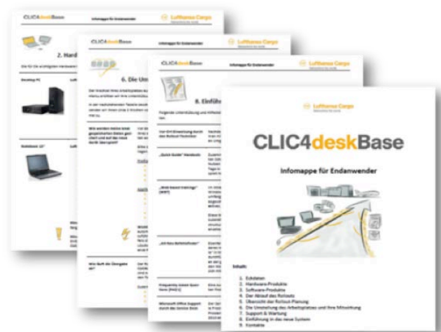
Abbildung: Umfangreiches, qualitativ hochwertiges Informationsmaterial zum Projekt für alle Anwender hat maßgeblich zur Akzeptanz beigetragen